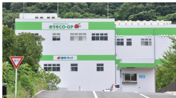
Trung tâm kiểm tra sản phẩm

検査の取り組みを確認いただくため、組合員の方は検査センターの見学をしていただけます。