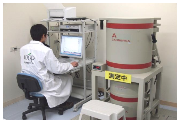
Kiểm tra nồng độ phóng xạ