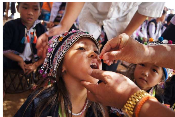
ポリオワクチンを接種するラオスの子ども

回収したペットボトルキャップは社会福祉法人に売却。就労支援施設で働く知的な障がいのある方たちが選別作業で活躍しています。