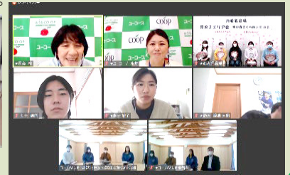
↑オンライン座談会