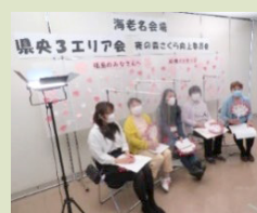
↑海老名名会場の様子

現地でボランティア活動をしている学生やユーコープから福島へ想いを寄せている組合員などによる座談会を開催しました。一般視聴者の皆さんからはチャットを使ってリアルタイムでコメントをお寄せいただきました。