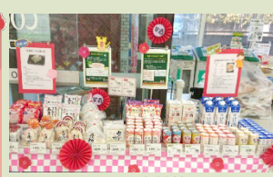
↑店舗特設コーナー