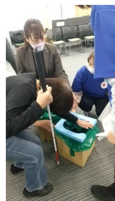
↑実際に商品に触れて体験している様子。