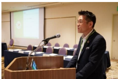
ユーコープからの報告の様子