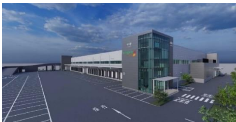
静岡ベース外装イメージ

2024年3月、静岡市駿河区恩田原に、物流センター・宅配センター・県本部機能を兼ね備えた施設「ユーコープ静岡ベース」を開設します。おうちCO-OPの利用者増加や、物流2024年問題に対応できるように物流機能の効率化を目指します。