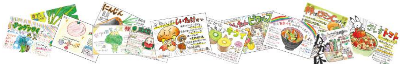
昨年受賞作品の一例