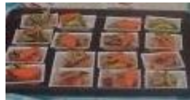
mio を参考に活メ銀鮭のマリネに