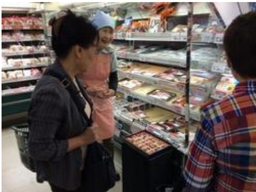
銀鮭のムニエルとゆず果汁ぽん酢和えを試食として提供