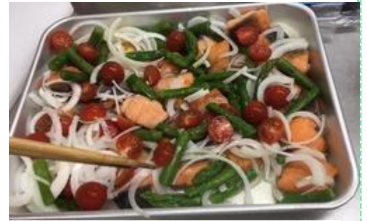
mi06月号の活メ銀鮭のマリネを作成

震災にもめげずに一生懸命作ってくださりありがとうございます。活メとてもおいしかったです。購入します。こんなにおいしく育てるのは手間もかかり大変だと思いますが、私たちは食べて応援します。がんばってください。身体に気を付けて、これからもおいしい鮭を楽しみにしています。