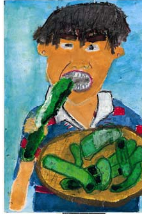
ほくのりょうり（小1）