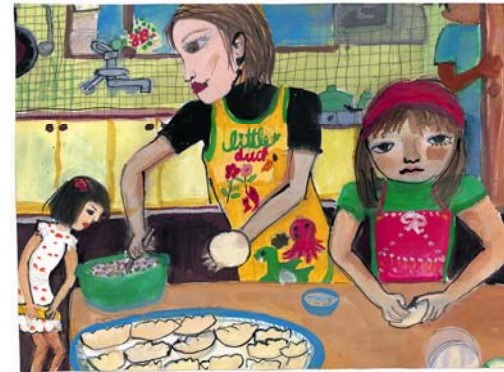
みんなでギョーザづくり（小4）