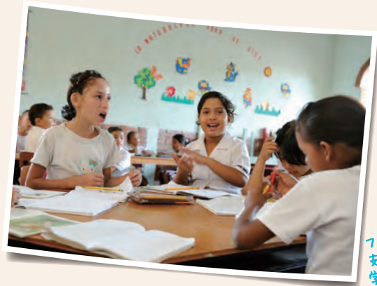
フェアトレードバナナの支援金で建てた学校で学ぶ子ども