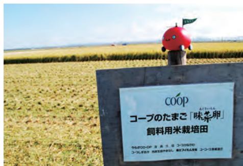
秋田県 大瀧村 飼料用米の田んぼ

2009年から、休耕田を利用して栽培した国産の飼料用米を味菜卵の親鶏の飼料に5% (赤玉は10%) 加えています。日本の食料自給率向上につながる取り組みです。