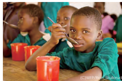
国連WFP「学校給食プログラム」を支援