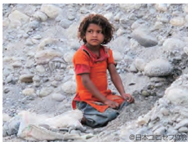
ユニセフは「児童労働と闘うネパール指定募金」を支援。

みるくぼさんでは 2008年から2014年までに 40,322,194円 寄付することができました。