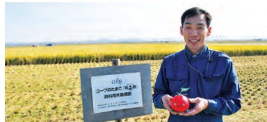
秋田県 大潟村 農業生産法人(有)せりた 飼料用米の田んぼ

2009年から、休耕田を利用して栽培した国産の飼料用米を味菜卵の親鶏の飼料に5%加えています。日本の食料自給率向上につながる取り組みです。