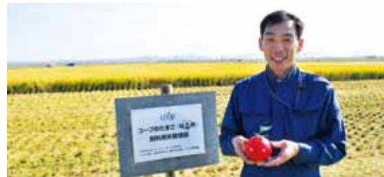
大潟村 農業生産法人(有)せりた 飼料用米の田んぼ

2009年から、休耕田を利用して栽培した国産の飼料用米を味菜卵の親鶏の飼料に5%加えています。日本の食料自給率向上につながる取り組みです。