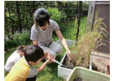
おうちで稲づくり「ひとめぼれチャレンジ」