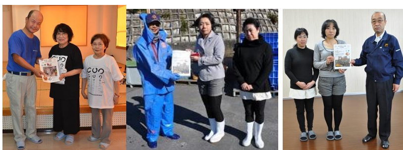
↑ 生産者へ大試食会の報告を組合員がお届けしている様子(2016年度)

みなさんで楽しく試食会を開催し、 秋田大潟村あきたこまちなりのファンを たくさん増やしましょう！ おいしい！の声や産地へのメッセージ、 ご意見・ご要望をたくさん集め、 産地の方へお届けしましょう！