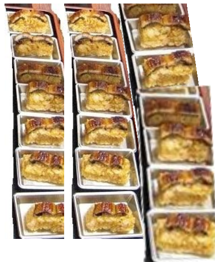
井田三舞店の様子

試食会の様子や、組合員から寄せられたうなぎの感想や生産者へのメッセージ、ほんの一部ですが、ご紹介いたします。