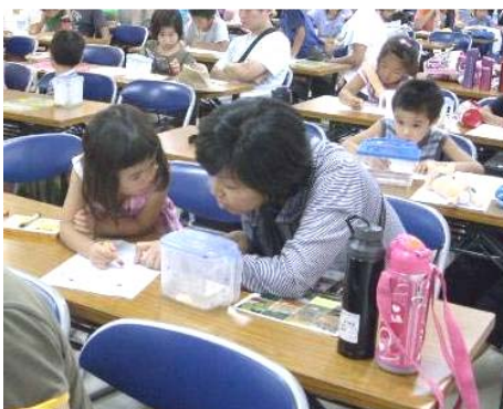
←子どもたちは画用紙に見つけた生き物を描き、大人は「生きもの川柳」に挑戦