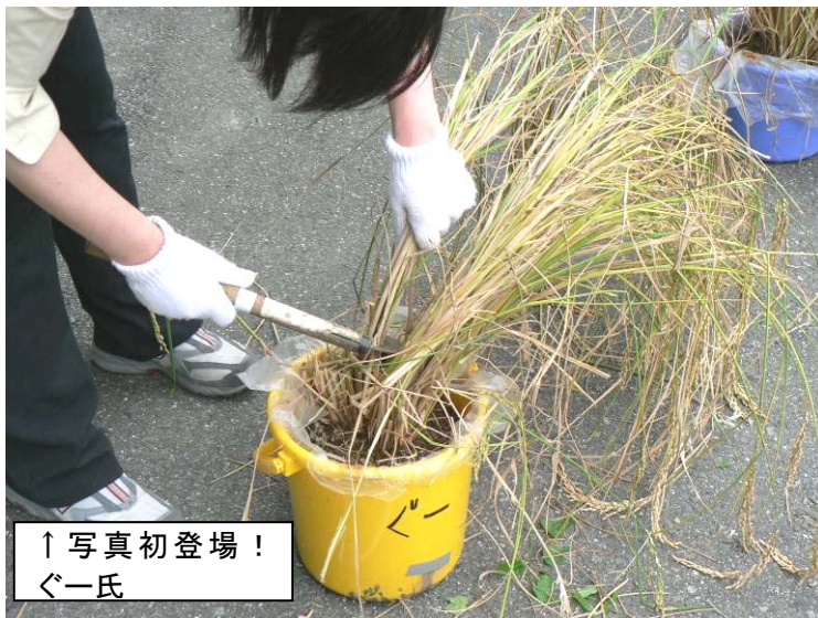
↑写真初登場! ぐー氏

ま、でも「 収穫したらどうせ干すんだから大丈夫だろ! 」と、今までの苦労を思い返しながら、万感の思いを胸に、いざ刈り取り!